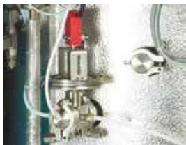
FVG - Membrane safety device for preventing lid opening even in case of minimal over pressure FVG - Dispositivo di sicurezza a membrana per evitare l'apertura del coperchio anche in case di minima sovrappressione