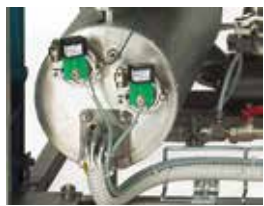
FVG & FVS - Steam generator FVG & FVS - Generatore di vapore