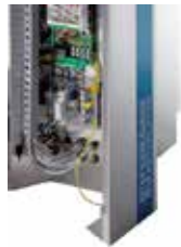
FVS - Stainless steel removable paneling FVS - Pannellatura removibile in acciaio inossidabile