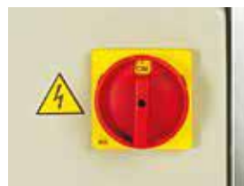
FVG - Main switch for emergency stop FVG - Interruttore principale per emergenza