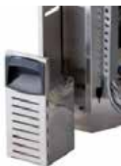
FVS - Front mounted condensate tank FVS - Tanica frontale per recupero condensa