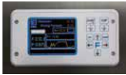
FVG & FVS - TSC 09 Microprocessor FVG & FVS - Microprocessore TSC 09