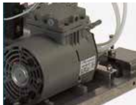
FVG & FVS - Air compressor FVG & FVS - Compressore aria