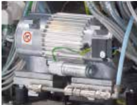
FVG - Vacuum pump FVG - Pompa del vuoto